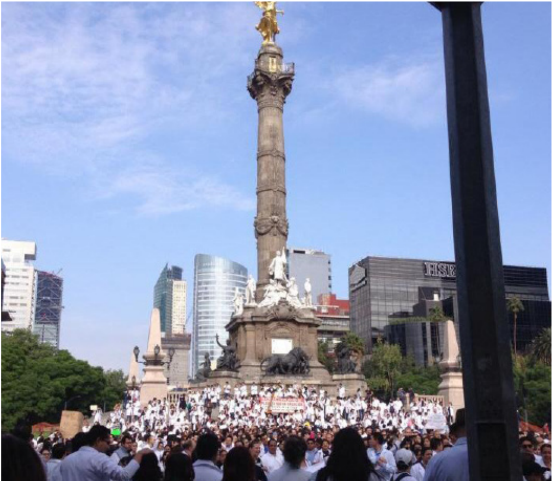
No somos criminales ni dioses. Foto: facebook #YoSoyMédico17.

que viven los trabajadores de la salud del país, del riesgo de quiebra de los sistemas de salud, y el despido masivo de los médicos; ésa es la otra gran característica de los movimientos emergentes, son manifestaciones de la crisis política y económica del país, por ello son imposibles de diluir tan fácilmente sin que dejen huella, experiencia y mejor organización en los sectores movilizados.