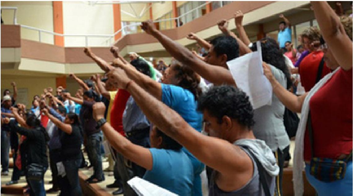
Ayutla de los Libres, Guerrero (29/NOV/2014).- Integrantes del Movimiento Popular Guerrerense (MPG) iniciaron la conformación de "Concejos Municipales Populares", que buscan sustituir a las autoridades electas por un poder ciudadano como nueva forma de gobierno. www.informador.com.mx/

Con acciones contundentes en la capital y regiones del estado, las masas lograron la caída del gobernador Ángel Aguirre Rivero y debilitar al régimen de la oligarquía en el estado, a donde el gobierno federal envió multimillonarios recursos y decenas de