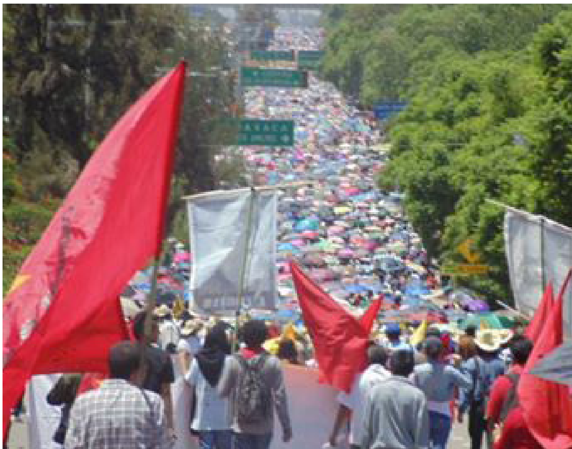
Sección 22 CNTE-SNTE, Oaxaca, 2013.

Entre otras, estos fueron los principales puntos de debate que se ocuparon de resolver las múltiples asambleas estatales, delegacionales y congresos realizados durante la primera mitad del 2013, de hecho el primer escenario de debate se dio casi a la par que se presentaba la iniciativa peñanietista, en el marco de las etapas estatal y nacional del XI Congreso Nacional Ordinario de la CNTE, la etapa nacional se realizó los días 14, 15 y 16 de diciembre del 2012, en la ciudad de Morelia, Michoacán.