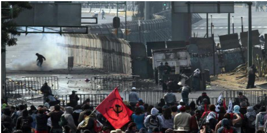
Bandera Roja. 1o. de diciembre de 2013. Palacio Legislativo.

ciativa de reforma a los artículos 3° y 73 constitucional, a lo que denominó reforma educativa, pero en su contenido era fundamentalmente una reforma laboral dirigida a los trabajadores de la educación en el país; esto provocó un cisma al interior del Sindicato Nacional de los Trabajadores de la Educación (SNTE), que hasta entonces todavía dirigía Elba Esther Gordillo Morales (EEGM), lo que obligó a esta dirigente charra, a pronunciarse titubeantemente contra esta reforma y ante su temor de perder el control al interior del sindicato por la gran inconformidad que estaba despertando esta reforma, a principios de enero, anunció un plan de acción que consistía en volanteo en todo el país los fines de semana, para supuestamente exponer su desacuerdo contra la reforma peñanietista; esta vacilación, provocó la detención y