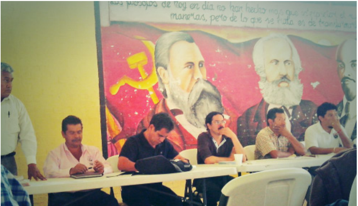
Aspecto de la Asamblea Nacional Popular.

El Movimiento Normalista. La táctica normalista, desde el 26 de septiembre