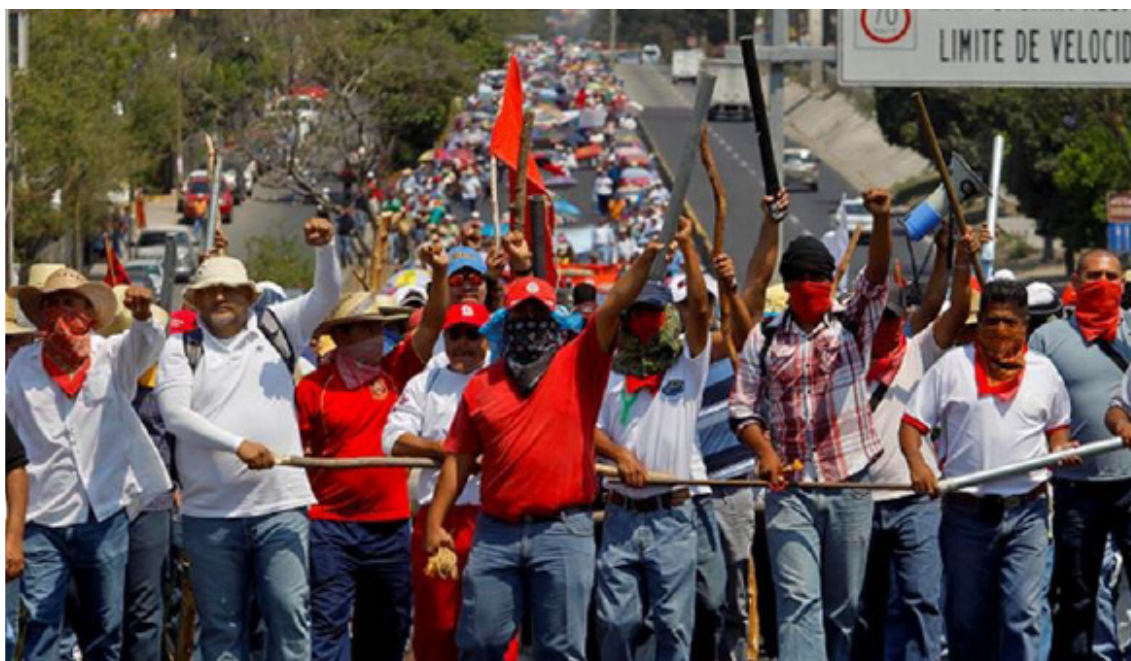
Marcha Ceteg. Odiseo, Revista electrónica pedagógica. Año 10, número 20, enero-junio de 2013. Abril 2013.

(CETEG), contingente miembro de la CNTE, logró realizar una firme política de alianzas con algunos sectores de base que se insubordinaron contra el charrismo del SNTE, con los trabajadores de la educación estatales aglutinados en el Sindicato Único de Servidores Públicos del Estado de Guerrero (SUSPEG), con los egresados de las escuelas normales, así como con los estudiantes de las escuelas normales del estado, organizados en el recién fundado Frente Unido de Normales Públicas del Estado de Guerrero (FUNPEG); tan pronto como se lanzaron a la calle, los miles de maestros movilizados realizaron tomas de oficinas, bloqueo de calles, e instalaron un platón indefinido en las calles de la ciudad de