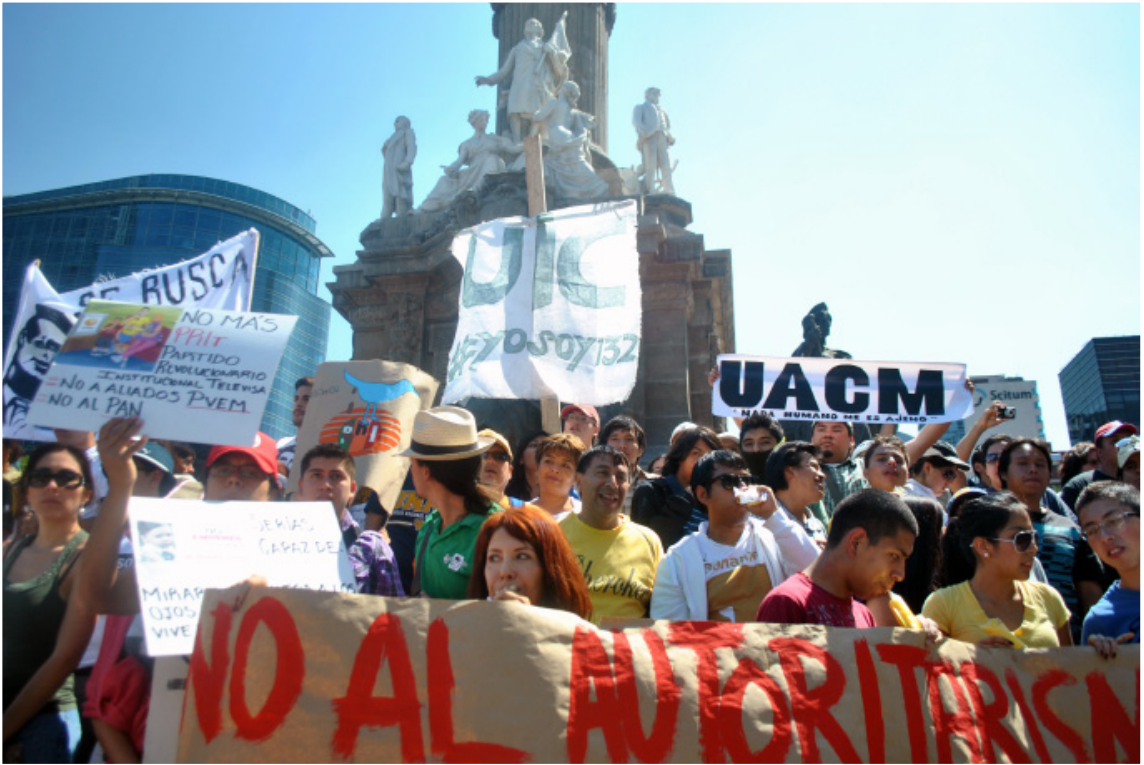
Marcha #YoSoy132.

hemos referido son: el #YoSoy132 que surgió a partir de la convocatoria de los 131 estudiantes de la Universidad Iberoamericana, quienes lograron impactar entre la juventud de todo el país, logró aglutinar y movilizar en las calles a todos quienes estaban inconformes con el retorno del PRI a Los Pinos mediante las elecciones del 2 de julio del 2012, el movimiento surgió el 15 de mayo del 2012 y en sólo unas semanas logró llenar prácticamente todas las plazas y calles del país, con la estruendosa consigna ¡No+PRI!, ganándose un reconocimiento internacional, puso de pie a la “hasta entonces apática” juventud mexicana;