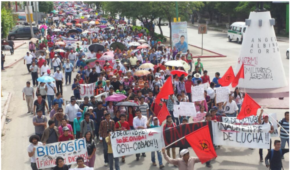
2 de Octubre. En Chiapas exigen al gobierno la presentación con vida de los 43 desaparecidos y castigo por la muerte de 3 normalistas de Ayotzinapa, Guerrero.

Esto ha tensado nuevamente la situación en Michoacán ya que, en los primeros días de enero, se volvió a registrar una masacre del Ejército mexicano contra población civil en Apatzingán, que ini-