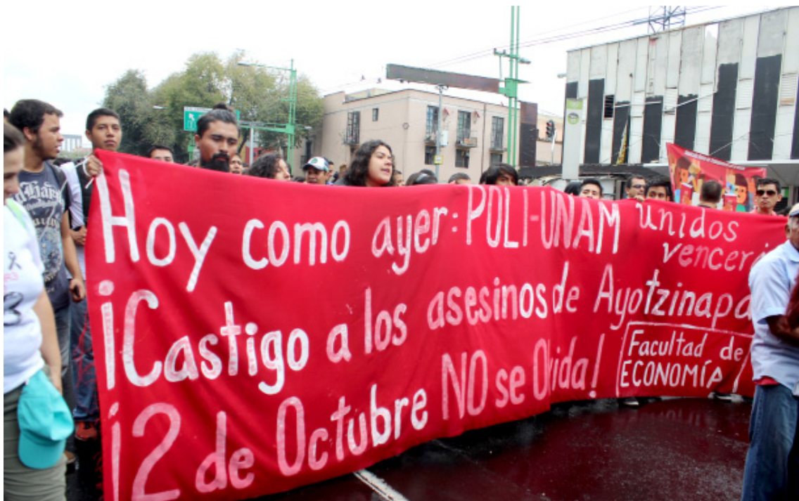
Continúa la tendencia a la Huelga Política General: Ayotzinapa, CNTE, Policías Comunitarias, Politécnico...

Aun cuando el movimiento todavía no se ha desarrollado al grado de instituirse en poder a nivel estatal, las enseñanzas tácticas en municipios, como Tecoaapa, preparan a las masas hacia ese objetivo, convirtiendo a Guerrero en otro estado más con experiencia insurreccional que, junto a Oaxaca con su más reciente experiencia en 2006, foguean a las masas proletarias y populares hacia el derrocamiento del régimen de la oligarquía financiera y la instauración de su propio poder.