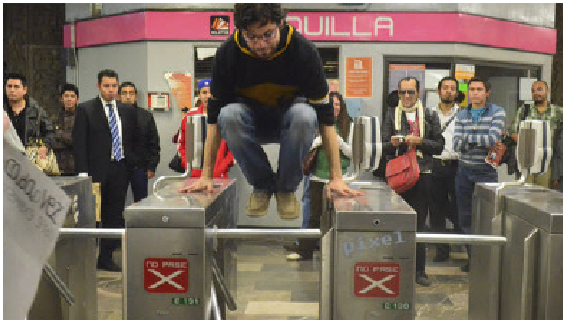
Ante la arbitrariedad del gobierno perredista de Miguel Ángel Mancera, #PosMeSalto, 2013.