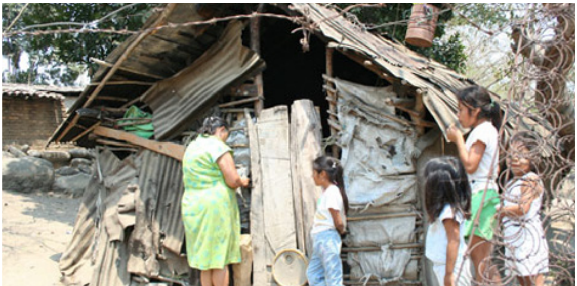
Hay seis millones más en la miseria en México. Cd. Juárez, Chih. México, 23 de agosto del 2014. www.larednoticias.com/noticias.cfm?n=33552

de los hidrocarburos, también será para incrementar las ganancias de las empresas trasnacionales; en lo económico el país crece su dependencia, particularmente a la economía norteamericana, por lo tanto, su “ mala suerte ” depende de la ley de la maximización de las ganancias de los monopolios de ese país imperialista.