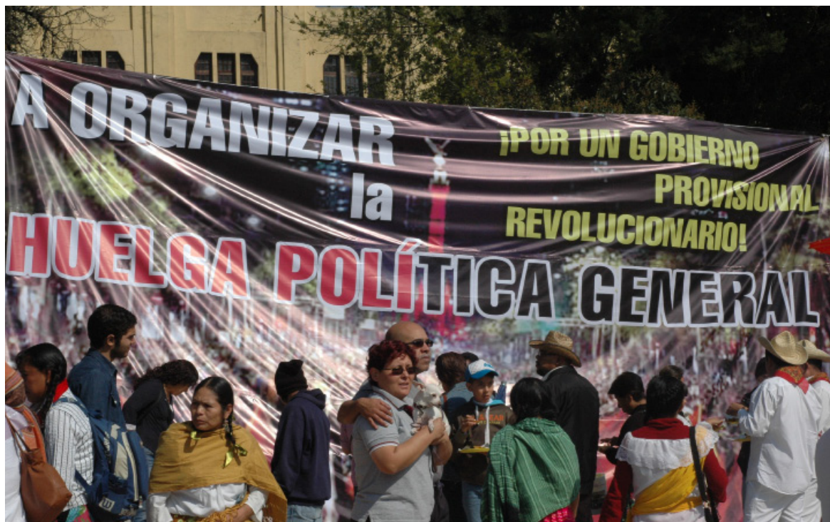
Diciembre 6 de 2014. Jornada de lucha en conmemoración del Centenario de la Toma de la ciudad de México en 1914 por Francisco Villa y Emiliano Zapata.

el ascenso de la lucha de masas en el país; está desarrollándose una tendencia hacia la crisis política del régimen: de aislamiento de EPN y su gabinete; descontrol y cierta desconfianza entre el propio gobierno; desconfianza de parte de ciertos sectores de la propia oligarquía financiera y la burguesía nacional hacia el gobierno. El ahondamiento de las contradicciones interburguesas, aunado con la presión de las masas que van logrando algunas victorias, demuestra esta fragilidad del régimen en la coyuntura actual.