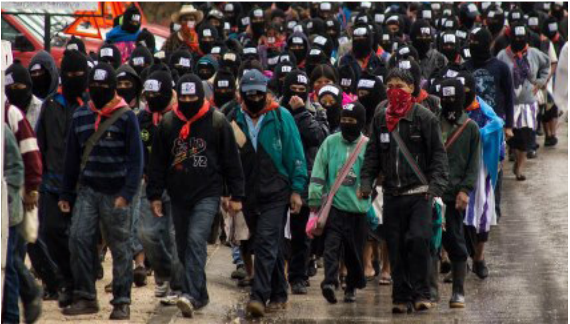
Pasos zapatistas en San Cristóbal de Las Casas, Chiapas. 21 de diciembre de 2013.

les, más la política agraria de abandono al campesinado y las compras de granos al exterior, cuyo impacto generó el abandono de las siembras y tierras fundamentalmente por el campesinado pobre y el éxodo de los arruinados hacia las principales ciudades del país y a los Estados Unidos.