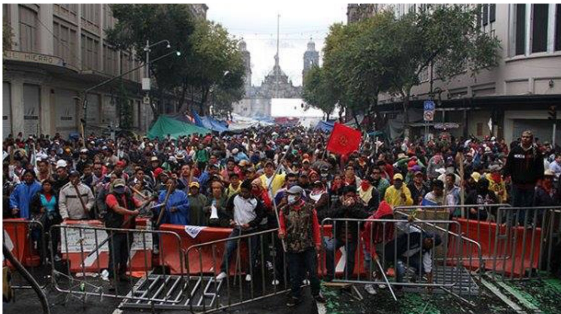
Batalla en el Zócalo de la ciudad de México, desalojo del Plantón Magisterial Popular de la CNTE, 13 de septiembre de 2013.

Huelga General, tampoco este proceso de Frente Único denominado Encuentro Nacional Magisterial y Popular logró consolidarse.