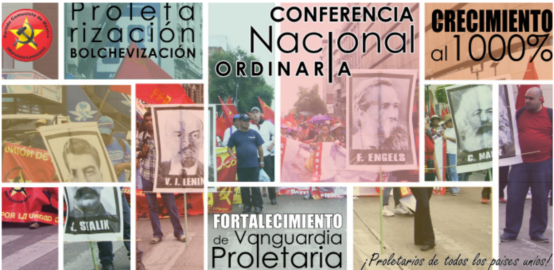
Los comunistas de México estamos en la lucha por un régimen democrático popular que allane el camino de la lucha por el socialismo. I Conferencia Nacional Ordinaria del PC de M (m-l), invierno de 2014.

En torno a las formas de lucha. Después del 26 de septiembre se han realizado las más diversas acciones, con la utilización de todas las formas de lucha, combinándolas todavía de manera muy básica pero importante. No insistiremos en acciones realizadas que arriba mencionamos, pero algo muy importante ha sido la utilización de la violencia organizada y de masas en el movimiento guerrerense, que se ha convertido en una cuestión cotidiana, colocando el tema de la violencia en el debate nacional, lo que ha constituido un verdadero desafío que requiere un estudio más amplio y una orientación más precisa.